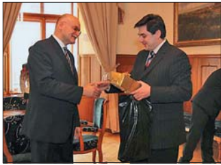
Velvyslanec Ruska v Olomouckém kraji