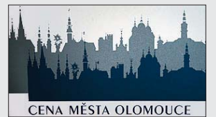
CENA MĚSTA OLOMOUCE